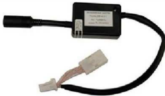
Адаптер Toyota-MB ver.4.1

Адаптер можно подключить к штатным магнитолам Toyota или Lexus, которые умеют управлять внешним штатным CD-чейнджером и имеют для этого соответствующий разъем.