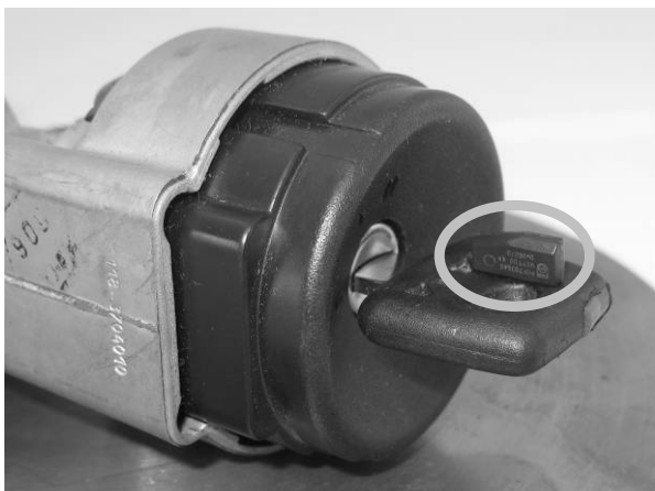
Рис. 1. Положение транспондера.

При включении и выключении зажигания, а также в то время когда зажигание включено, требуемый транспондер (или брелок сигнализации) должен находиться в зоне действия антенны замка зажигания. Правильное положение транспондера и брелока показано на рис.1 и рис.2.