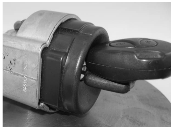
Рис. 2. Положение брелока.